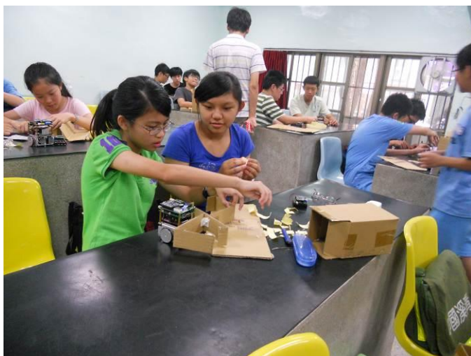
圖 3. 發揮創意改裝車輛