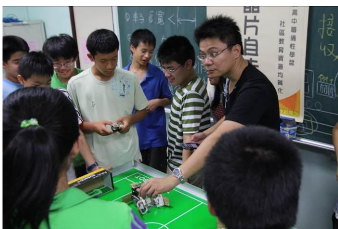
圖 5. 激烈競賽展開