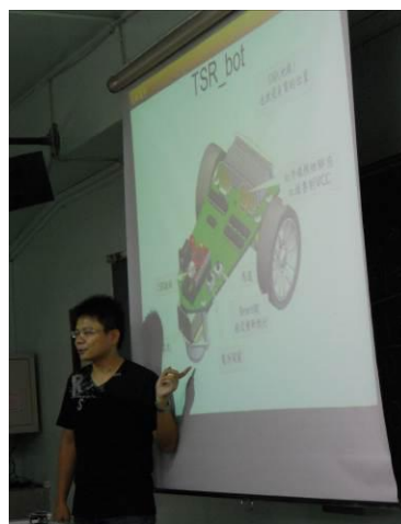
圖 2. 自走車講解與授課