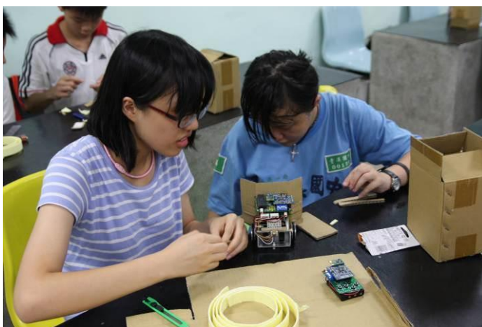
圖 4. 發揮創意改裝車輛