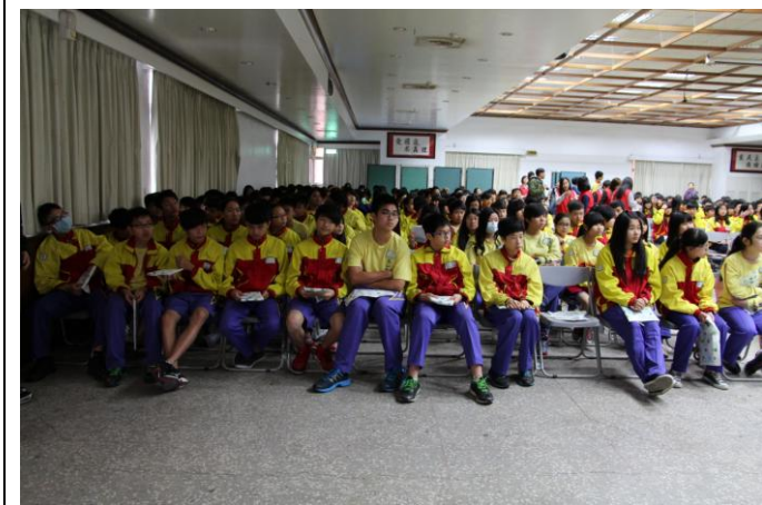
歡迎龜山國中師生參訪情形