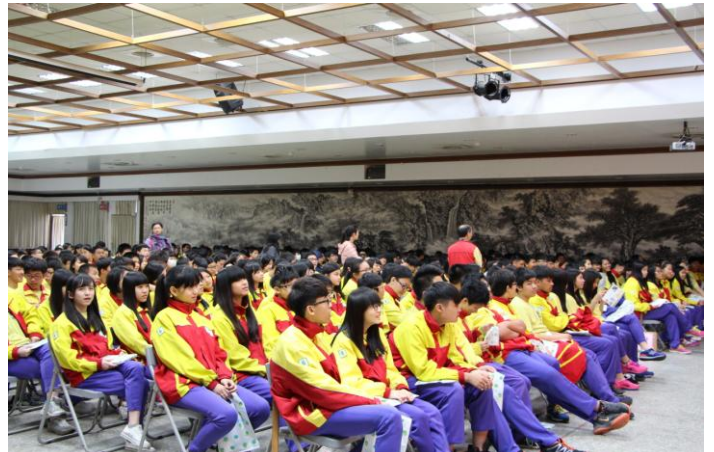
歡迎龜山國中師生參訪情形