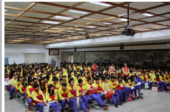
歡迎龜山國中師生參訪情形