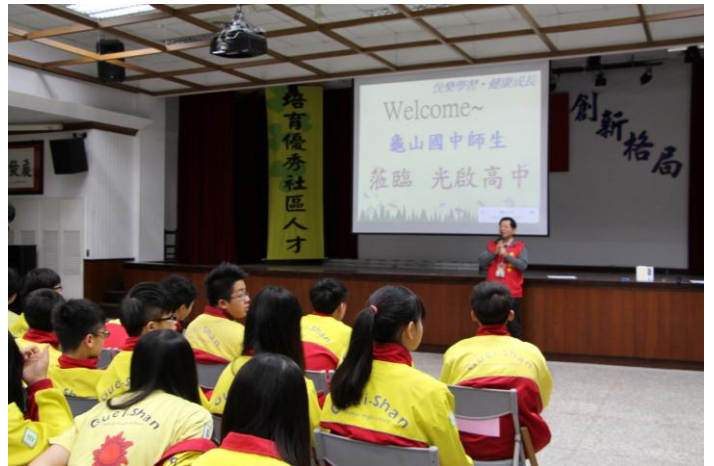
歡迎龜山國中師生參訪情形